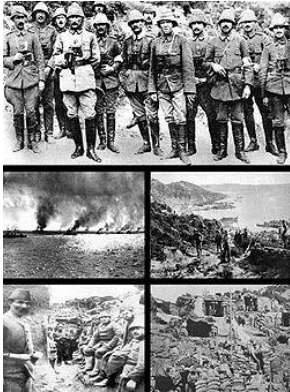
Distintas alternativas de la batalla

Le dan el ducado de Lancaster, que es meramente decorativo, sin función alguna, llega a la conclusión que su carrera está terminada. Se dedica a la pintura y a W.S.Blunt le comenta: "Hay más sangre que pintura en estas manos" , los remordimientos por la muerte de tantos jóvenes en Dardanelos estaban haciendo mella en su persona, motorizado por su aislamiento político.