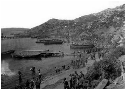
Desembarco en Gallipoli, la hora del desastre

El reinicio de la operación es el 25 de abril, 12.000 hombres son desembarcados el primer día, de los cuales un tercio será muerto o herido, los turcos desde sus casamatas situadas en la altura disparan a mansalva, haciendo un desastre entre las tropas anglo francesas. Nuevos ataques en mayo y junio culminaron en sendos fracasos, cunde la desmoralización y la disentería entre las tropas. Finalmente el 8 de diciembre de 1915 se decide el reembarco, el costo fue macabro, 250.000 hombres, entre muertos, heridos, desaparecidos y enfermos.