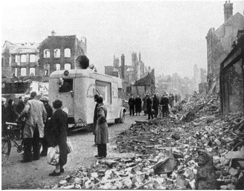
Desolación en Coventry, nadie fue avisado

La prensa británica se preguntaba porque no hubo plan de evacuación, teniendo Coventry la mayor concentración de industrias militares de todo el país.