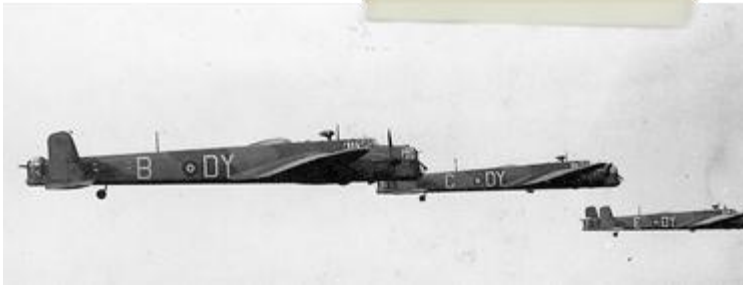
Bombarderos Whitley, con estos aparatos comenzaron los ingleses la escalada de destrucción

En Monchengladbach, poco después de la medianoche, las bombas inglesas mataron 4 civiles, fueron derribados 3 de 36 aviones, las noches siguientes continuaron los bombardeos al azar sobre poblaciones alemanas, Essen y otras dos ciudades fueron víctimas, nuevamente el Ministerio del Aire británico lo desmintió; “Essen no se encontraba entre los objetivos bombardeados por la RAF anoche ni anteanoche”.