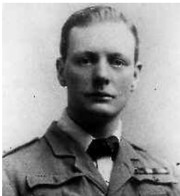
Churchill en 1899, corresponsal del Morning Post

WSC participa también de la guerra contra los Boers sudafricanos y a su vez escribe libros de sus experiencias, así como es corresponsal de un diario, lo que lo catapultó a la fama en su país.