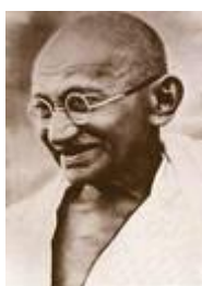
Gandhi, según Churchill, un fanático malhechor

Fue por esa época que WSC empezó una campaña para no perder la joya más preciada de la Corona británica, la India, su ardor imperial se hallaba en disidencia con la política oficial. Consideraba a Gandhi un “fanático malhechor”, sostenía que la represión era el único método valido para acabar con el problema, su discurso hace aflorar su espíritu imperialista y dominador del inglés de raza superior, según nos dice François Bédarida.