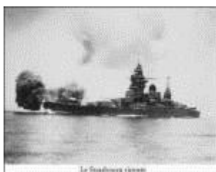
El Strasbourg se defiende del artero ataque

Mientras tanto Churchill vocifero un enardecido discurso en el parlamento, recibiendo vítores, gritos y pañuelos en alto, la Marina francesa nunca olvidaría la forma artera en que morirían 1300 de sus marinos, Churchill el señor de la guerra cumplía con su ineluctable destino.