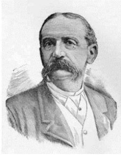
Leonard Jerome, financista de Wall Street, abuelo de Churchill