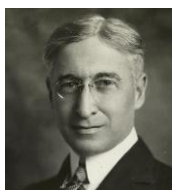
Baruch, ayudó económicamente a Churchill

También Churchill se hizo amigo de Bernard Baruch en su visita a EEUU en 1931 que como Focus habría ayudado financieramente al apurado Winston.