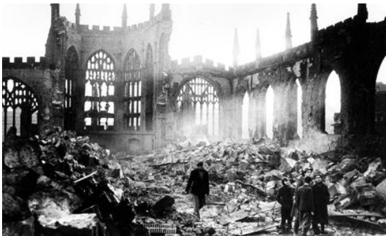
Catedral de Coventry, después del Blitz

El mando alemán explico que el ataque fue en represalia por el que había sufrido Múnich durante el discurso de Hitler.