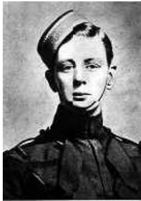
El joven Winston en la academia de Sandhurst

Tanto Lord Randolph como Lady Jenny llevaban una vida atrapada por fiestas y juergas, muy alejada de sus hijos, su madre tuvo varios amantes, por lo que su hermano John no sería hijo de Lord Randolph, lo que marcó la vida del pequeño pelirrojo Winston, de tal manera que en su vida escolar fue caratulado de “indisciplinado” “glotón” y “desordenado”. En la adolescencia sufrió las primeras crisis de depresión que él llamaba sus “perro negro”, que lo acompañó durante toda su vida. Dicen que esa depresión fue el motor de su insaciable ambición y su hiperactividad, el “niño rico” abandonado por sus padres se transformaría en ese ser dueño de un egocentrismo radical, absoluto y a menudo monstruoso.