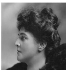
Lady Jenny, madre de Churchill