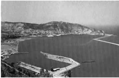
Bahía de Mers el Kebir, escenario del increíble ataque británico