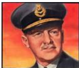
Arthur "Bomber" Harris, especialista en crímenes de civiles

Julio de 1939 , cien bombarderos británicos despegaron desde Inglaterra volando hasta Burdeos, Francia. Unos días después cien mas lo hicieron pero hasta Marsella, luego doscientos cuarentas hasta Marsella y Burdeos. Había planes de “vuelos lanzadera”, grandes formaciones de aviones partirían de Inglaterra, bombardearían Alemania y aterrizarían en Polonia o viceversa. Chamberlain, entonces Primer ministro se negaba a considerar estos planes, no quería una escalada de destrucción, la prensa pedía la entrada de Winston Churchill al gabinete, argumentando que este era un guerrero y que si sabía de bombardeos, el tiempo les dio la razón, Churchill sabía mucho del tema.