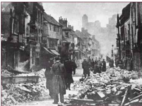
Gosford street destruida en Coventry, la venganza alemana