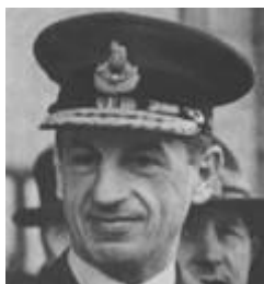
Charles Portal, sin escrúpulos

Charles “Peter” Portal participo en la IGM en la RAF bombardeando soldados alemanes por las noches. Sus dotes para esta tarea las perfeccionó en el sur de Yemen, en 1934, donde machacó con bombardeos que duraron semanas a la tribu Qutaibi, quitándole toda voluntad de combatir. Esta experiencia la plasmo en conferencias que fue considerada un ejemplo clásico de la aplicación de los principios de dominio del aire.