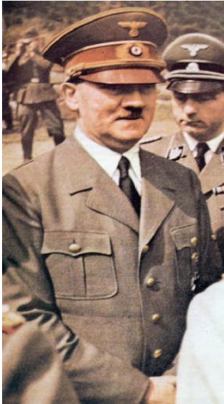
Advirtió a Churchill por los bombardeos nocturnos