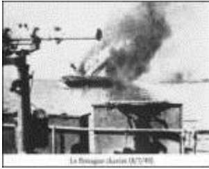
Fin del acorazado Bretagne