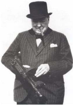
WSC, no avisó a Coventry de lo que se venía

ni a las ambulancias. Solamente veinte minutos antes un equipo antiaéreo de la ciudad recibió un mensaje; “Se espera un gran ataque a Coventry esta noche”.