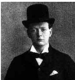
Churchill, flamante parlamentario

Gracias a sus ansias de ganar notoriedad a cualquier precio y sus hazañas en África, empieza su carrera política, siendo a los 25 años elegido diputado conservador de Oldham. El 14 de febrero de 1901 jura como diputado, teniendo una extensa actuación en la Cámara de los Comunes que duraría 62 años.