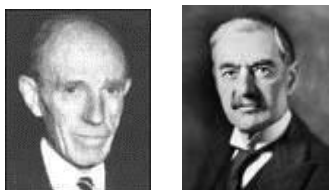
Halifax, rival de Churchill

Un sondeo hecho en 1939 preguntando que si renunciara Chamberlain a quien elegiría como Primer Ministro, dio como resultado Eden 38 %, Churchill 7 % Y Halifax el 7 %.