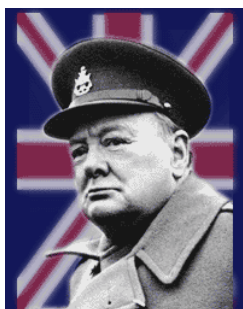
Fiel exponente del imperialismo británico

Seguidamente reseñaremos la política de bombardeos indiscriminados del Primer Ministro inglés, debimos elegir un tema debido a lo extenso de la vida pública de WSC.