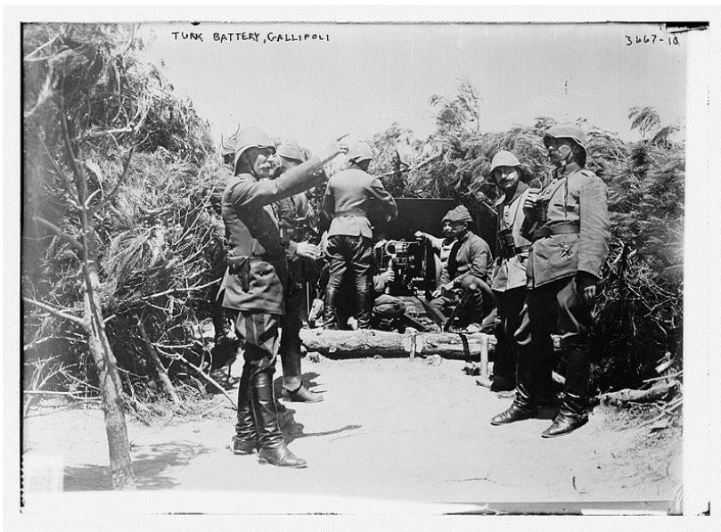
Batería turca, letal para los invasores

Sin embargo en las idas y venidas de la política inglesa, WSC tiene una nueva oportunidad, Lloyd George forma nuevo gobierno en 1916 y el año siguiente nombra a Churchill Ministro de Municiones, los conservadores ponen el grito en el cielo, pero el Primer Ministro se mantiene firme.