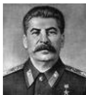
Lenin, el monstruo que reptaba - Antes enemigos del género humano según Churchill.-después aliados

Para WSC los bolcheviques “Son enemigos del género humano” que gobiernan “a golpes de masacres y asesinatos en masa”, “De todas las tiranías de la historia, la tiranía bolchevique es la peor, la más devastadora, la más envilecedora”